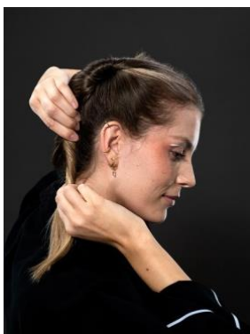
Bild 2: Steck deine linke Partie zur Seite, damit sie dich beim Frisieren des ersten Zopfes nicht stört.

Bild 1: Schütze dein frisch gewaschenes Haar mit etwas Taft Hitzeschutz-Spray und trockne es gut. Bürste deine Mähne noch einmal durch und setze mithilfe eines Stilkamm einen Mittelscheitel vom Ansatz bis tief in den Nacken. Damit dir deine Haare beim Flechten nicht so leicht aus den Fingern gleiten, empfehlen wir dir sie mit etwas Taft Volumenpuder zu fixieren.