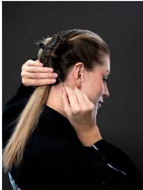
Bild 4: Fixiere deinen eingedrehten Dutch Braid im Nacken mit einem dünnen Zopfgummi. Fertig ist der erste Zopf! Bereit für die zweite Hälfte?

flechtest du dir den ganzen Zopf. Nach und nach nimmst du seitlich immer wieder eine neue Strähne auf und flechtest deinen Zopf so bis zum Nacken.