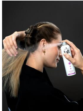
Bild 5-6: Lockere die geflochtenen Zöpfe vorsichtig, um einen perfekten messy Look zu kreieren. Drehe beide Zöpfe von oben beginnend bis zum Nacken nach innen ein und stecke sie gut mit Bobby Pins fest, sodass der Zopf wie eine längere Rolle aussieht! Für ein geschmeidiges Finish bürste die offenen Enden sanft durch und bändige sie mit etwas Haaröl. Damit deine Frisur auch den ganzen Tag hält, fixierst du zum Schluss alles mit dem neuen Taft Classic Haarspray.