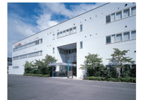
横浜/ アジアパシフィック技術センター