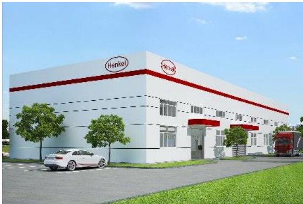
大手自動車メーカーとその供給業者の拠点に近接した 蘇州工業園区に位置

ヘンケル社はこの度中国・蘇州にアジア太平洋地域初の含浸サービスセンターを開所しました。この新しいサービスセンターは2014年11月に開所し、本年度より屈指の革新的な含浸技術をアジア、その他の新興市場に提供して参ります。