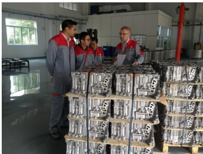
社内専門家の技術サービスエンジニアが 世界レベルの品質とサービスを提供

ヘンケルは創立以来、鋳造所、自動車工場、機械産業を出身とする専門家を擁してきました。今後はこのロックタイト含浸サービスセンターをさらに拡張して、クオリティーが高く革新的な技術を以前にも増して求めているアジア自動車市場のニーズに対応していきます。