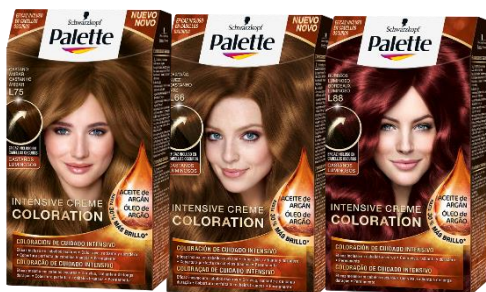
Castaño Ámbar, Castaño Nuez, Avellana Luminoso, Burdeos Luminoso