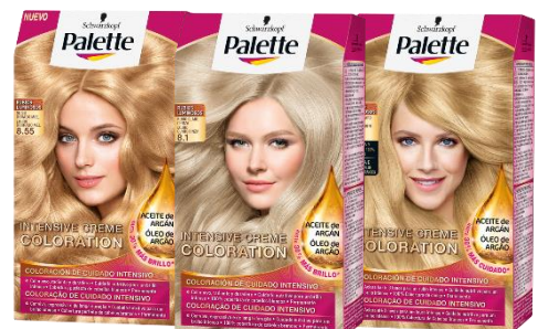
Rubio Dorado Miel, Rubio Claro, Rubio Claro Claro, Rubio Claro Ceniza y Rubio Claro Claro Helado